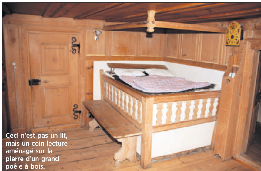
Ceci n'est pas un lit, mais un coin lecture aménagé sur la pierre d'un grand poêle à bois.