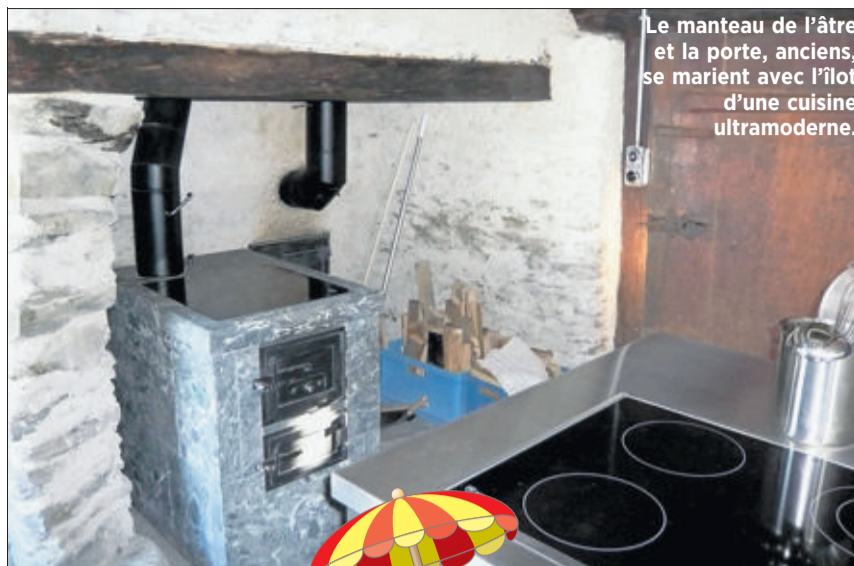
Le manteau de l'âtre et la porte, anciens, se marient avec l'îlot d'une cuisine ultramoderne.