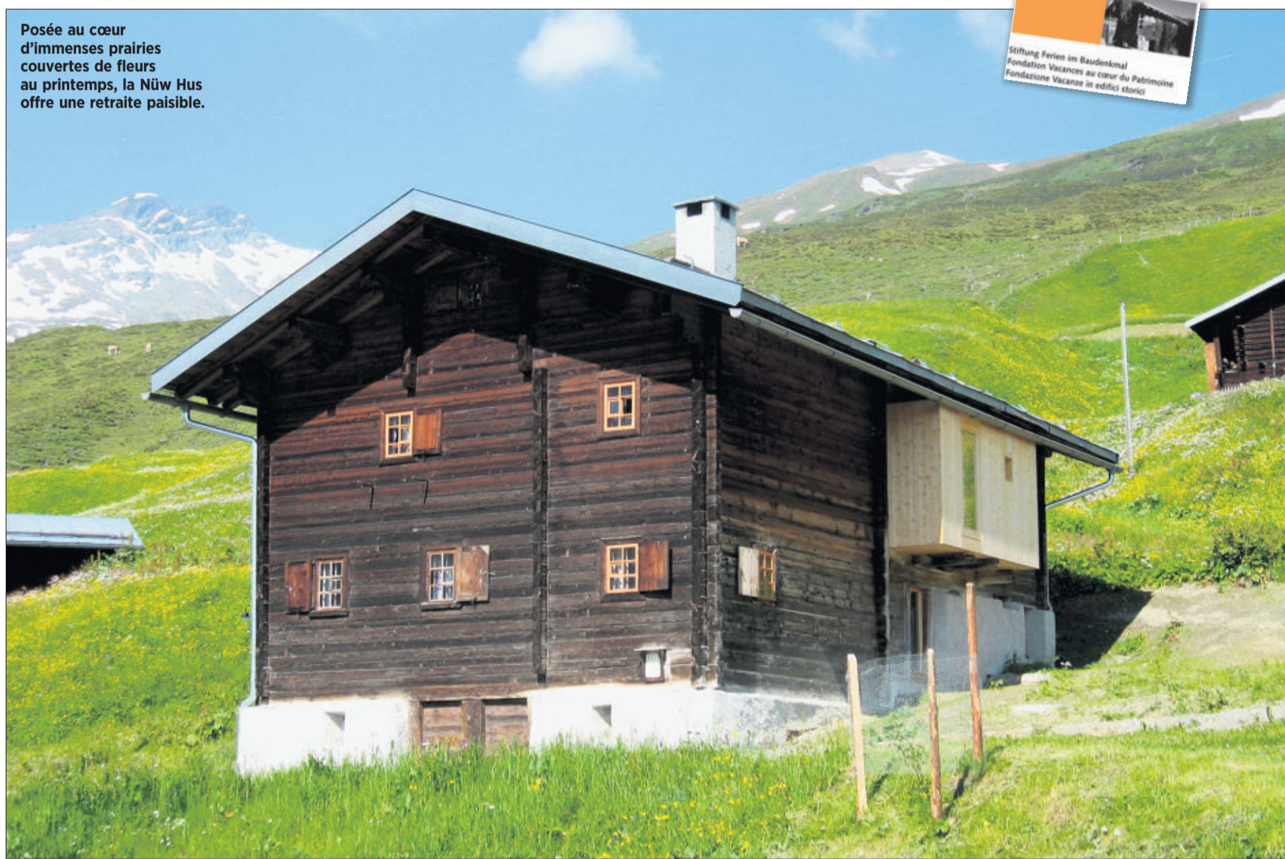
Posée au cœur d'immenses prairies couvertes de fleurs au printemps, la Nüw Hus offre une retraite paisible.

La Nüw Hus jouit aujourd'hui d'un confort coquet. La cave à lait et le garde-manger, ont été transformés. La première en sani-